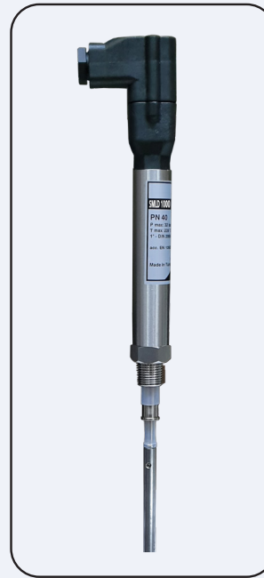
Seviye Alarm Probu